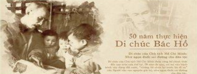
50 năm thực hiện Di chúc Bác Hồ

Di chúc của Chủ tịch Hồ Chí Minh: Niềm tin được soi đường cho dân tộc.